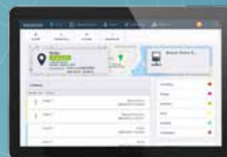
Cerberus Tunnel voor programmeren