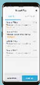
Cerberus Test App

De Cerberus Cloud bestaat uit drie cloud-gebaseerde oplossingen: